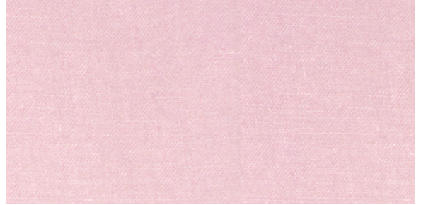
Leinen Hellrosa Preis: ab 79 EUR