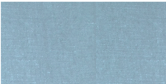
Leinen Hellblau Preis: ab 79 EUR