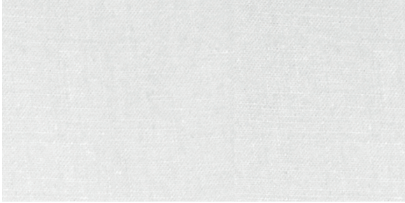
Leinen Weiß Preis: ab 79 EUR