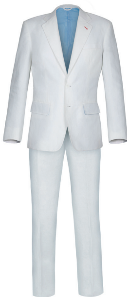
Anzug Leinen Weiß Preis: ab 349 EUR