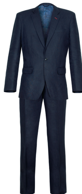
Anzug Leinen Navy-Blau Preis: ab 349 EUR